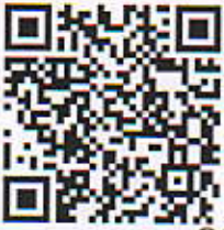
ГРАФИК ПЛАТЕЖЕЙ* к договору (контракту) от 16 . К .2022 г. № 1

между ООО "GIGANT PROEKT" и Койликул тумани Халк таълими булими (МБ) на общую сумму 607000000,00