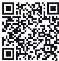
ГРАФИК ПЛАТЕЖЕЙ* к договору (контракту) от 16.05.2022 г. № 5

между ООО "GLOBAL PRODUCT" и Республикалык Каракалпак Лепрозорияси на общую сумму 502844508,00