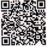
ГРАФИК ПЛАТЕЖЕЙ* к договору (контракту) от 16.05.2022 г. №10

между ООО "GLOBAL PRODUCT" и УзР Соғлиқни сақлаш вазирлиги суд-мед экспертизаси илмий-амалий маркази Қорақалпоғистон филиали на общую сумму 674 166 521,00