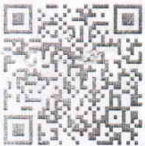
ГРАФИК ПЛАТЕЖЕЙ* к договору (контракту) от 10.05.2022 г. № ET72012

между ХК SAMARKAND SMART STANDART SERVICE и Самарканд шаҳар ХТБ марказ на общую сумму 163004000,00