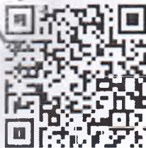
ГРАФИК ПЛАТЕЖЕЙ* к договору (контракту) от 19.05.2022 г. № 1

между "Обод юрт равнаки" МЧЖ и Олтинсой туман ХТБ на общую сумму 390420500,00