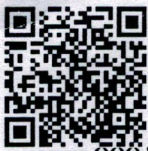
ГРАФИК ПЛАТЕЖЕЙ* к договору (контракту) от 07.05.2022 г. № ИК/03-22

между ООО "MODERN PROEKT NUKUS" и Инжиниринговая Компания СЕЗ СМ РК на общую сумму 43789000,00