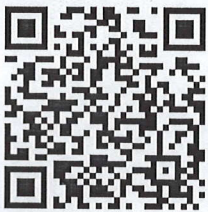
ГРАФИК ПЛАТЕЖЕЙ* к договору (контракту) от 18.04.2022 г. № 63519

между "Олтин тола замини" хусусий фирмаси и Гиждувон туман МТБ на общую сумму 718830000,00