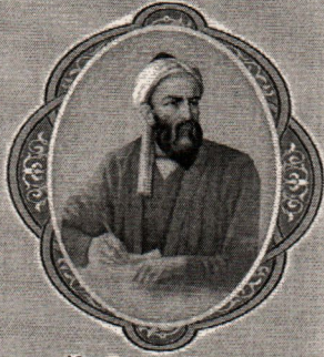
Abu Rayhon Beruniy (973-1048)