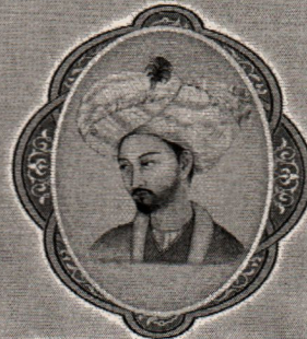
Zahiriddin Muhammad Bobur (1483-1530)