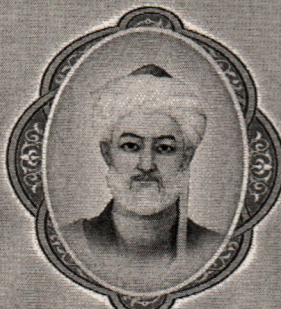
Alisher Navoiy (1441-1501)