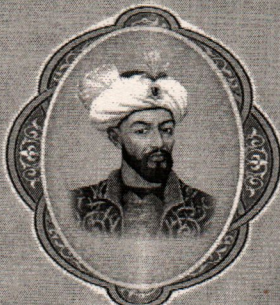
Mirzo Ulug'bek (1394-1449)