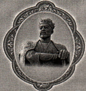
Amir Temur (1336-1405)