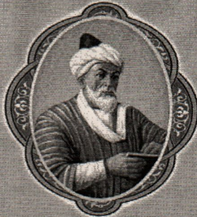
Ahmad al-Farg'oniy (790-865)