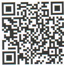
ГРАФИК ПЛАТЕЖЕЙ* к договору (контракту) от 26.05.2022 г. № 22777

между OUS-MAXBUILDING МЧЖ и Жанубий Мирзачул магистрал канали бошкармаси на общую сумму 312500000,00