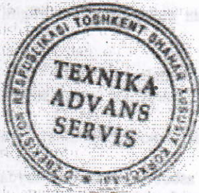
Raxbar / Mirayubov M.M./