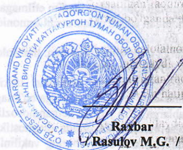
Raxbar / Rasulov M.G./