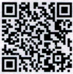
ГРАФИК ПЛАТЕЖЕЙ* к договору (контракту) от 07.05.2022 г. № 21-22

между ПТМ Архторус и Инжиниринговая Компания СЕЗ СМ РК на общую сумму 39764000,00