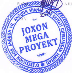
Рис: А. Шукруров

"Жохон Мера Проект" МЧЖ Мангил: Andijon viloyati, Andijon shahri, ITTIFOQ KUCHASI 115-UY Тел./факс: +998914997373 x/p: 20208000000841945001 Банк номи: Ушаноткурликбанкити Андижон вилояти ф МФО 00075 СТИР 305282105