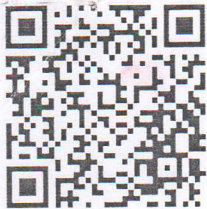
ГРАФИК ПЛАТЕЖЕЙ* к договору (контракту) от 09.06.2022 г. № 1

между Nanoprojekt va texnologiya MC и Ховос туман ХТБ на общую сумму 18500000,00