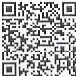
ГРАФИК ПЛАТЕЖЕЙ* к договору (контракту) от 14.06.2022 г. № 2022-348-2-34-МТ

между "Олтин тола замини" хусусий фирмаси и Гиждувон туман МТБ на общую сумму 149800000,00