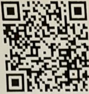
ГРАФИК ПЛАТЕЖЕЙ* к договору (контракту) от 02.06.2022 г. № 109

между New Sirdarya МЧЖ и Сирдарё туман Ободонлаштириш бошкармаси на общую сумму 33 451 165,00