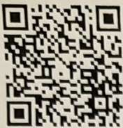
ГРАФИК ПЛАТЕЖЕЙ* к договору (контракту) от 02.06.2022 г. № 107

между New Sirdarya МЧЖ и Сирдарё туман Ободонлаштириш бошкармаси на общую сумму 61 280 030,00