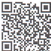
ГРАФИК ПЛАТЕЖЕЙ* к договору (контракту) от 02.06.2022 г. № 42-ОВ

между "TRADITIONALLY TRADE" МЧЖ и Учкургон ХТБ марказ на общую сумму 535530254,99