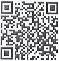
ГРАФИК ПЛАТЕЖЕЙ* к договору (контракту) от 20.06.2022 г. № 101969

между "Олтин тола замини" хусусий фирмаси и 63-ихтисослаштирилган мактаб-интернат на общую сумму 14354500,00