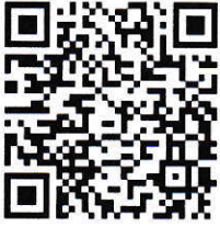
ГРАФИК ПЛАТЕЖЕЙ* к договору (контракту) от 21.06.2022 г. № 3

между "ADXAM TAMIRSOZ BIZNES" МЧЖ и Охангарон шаҳар ХТБ на общую сумму 234000000,00