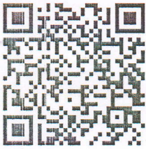
ГРАФИК ПЛАТЕЖЕЙ* к договору (контракту) от 20.06.2022 г. № 31

между "Кизилтепа курилиш транс" мчж и Қизилтепа туман ХТБ на общую сумму 195442550,00