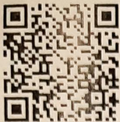
ГРАФИК ПЛАТЕЖЕЙ* к договору (контракту) от 22.06.2022 г. № 39 между "Yaksart-gold" МЧЖ и Сирдарё туман Ободолаштириш бошкармаси на общую сумму 237 513 300,00

Глава 110 Казначейский лицевой счёт 100022860242317045204110008