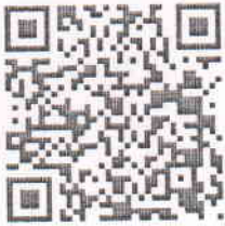
ГРАФИК ПЛАТЕЖЕЙ* к договору (контракту) от 22.06.2022 г. № 1

между "ABLE JENERAL BM" MCHJ и Бука ХТБ центр на общую сумму 10649000,00