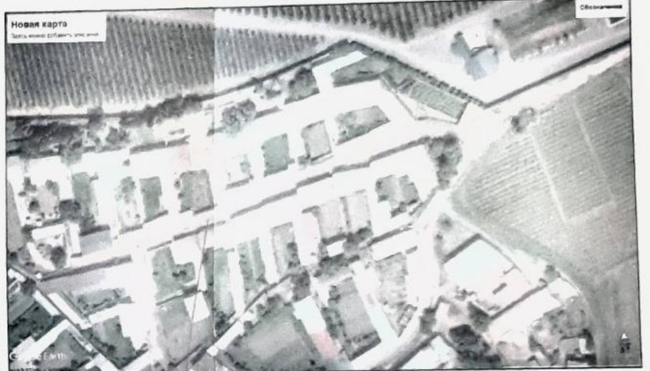
Участок под строительство