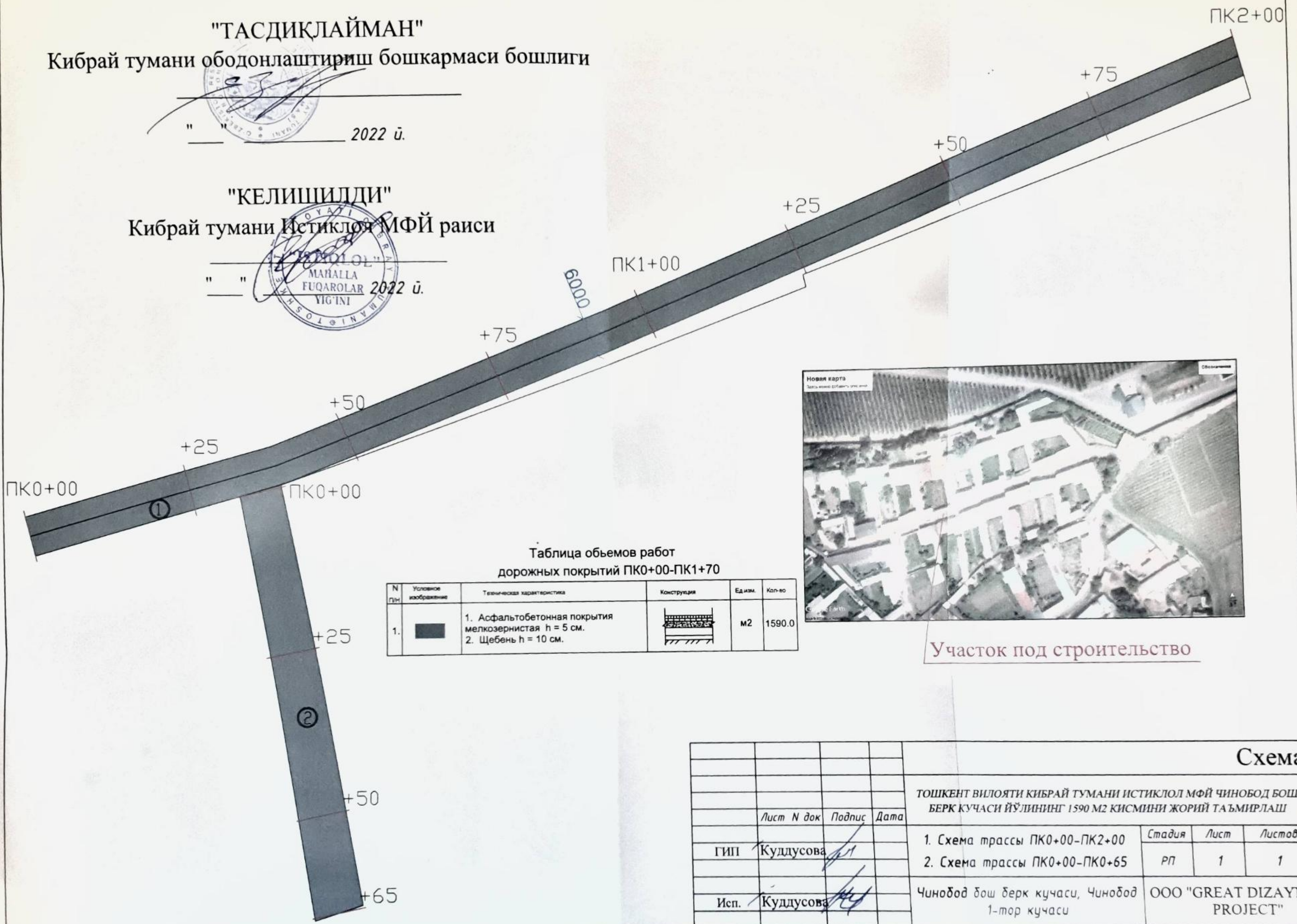
Таблица объемов работ дорожных покрытий ПК0+00-ПК1+70