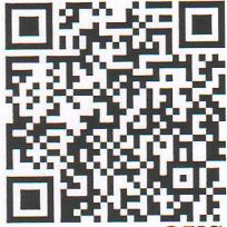
ГРАФИК ПЛАТЕЖЕЙ* к договору (контракту) от 22.06.2022 г. № 103217

между OUS-MAXBUILDING МЧЖ и Жанубий Мирзачул магистрал канали бошкармаси на общую сумму 191000000,00