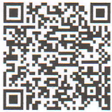
ГРАФИК ПЛАТЕЖЕЙ* к договору (контракту) от 23.06.2022 г. № 2022-368-5-72-ХТ

между Навоий универсал бизнес 2022 ок и Қизилтепа туман ХТБ на общую сумму 106300000,00