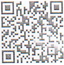
ГРАФИК ПЛАТЕЖЕЙ* к договору (контракту) от 27.06.2022 г. № 1

между Кумкўрғон Мега Инвест МЧЖ и Кумкўрғон Педагогика коллежи на общую сумму 31680000,00