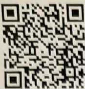
ГРАФИК ПЛАТЕЖЕЙ* к договору (контракту) от 03.06.2022 г. № 28

между Магнетрал йул монтаж МЧЖ и Сирдарё туман Ободонлаштириш бошкармаси на общую сумму 19 564 000,00