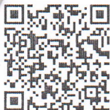
ГРАФИК ПЛАТЕЖЕЙ* к договору (контракту) от 29.06.2022 г. № 2022-94-5-72-ОВ

между Кизилтепа злга хизмат МЧЖ и Кизилтепа Ободонлаштириш бошкармаси на общую сумму 21850000,00