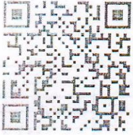
ГРАФИК ПЛАТЕЖЕЙ* к договору (контракту) от 30.06.2022 г. № 19

между "PAYARIQ QURILISH SERVIS" MCHJ и Жомбой туман ХТМБ марказ на общую сумму 121000000.00