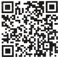
ГРАФИК ПЛАТЕЖЕЙ* к договору (контракту) от 30.05.2022 г. № 15

между МЧЖ "Сарбон Мебел Барака" и Бухоро шахар МТБ на общую сумму 1299861300,00