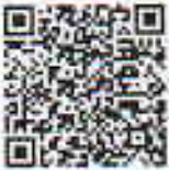
ГРАФИК ПЛАТЕЖЕЙ* к договору (контракту) от 06.07.2022 г. № 16-111276

между "Бухоро саноат" МЧЖ и Бухоро сахар хокимлиги ободонлаштириш бошкармаси на общую сумму 514614489,00