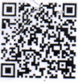
ГРАФИК ПЛАТЕЖЕЙ* к договору (контракту) от 1.07.2022 г. № 2022-190-2-41-IV

между :Жондорлик Гулирайхон О/К и Шофиркон туман Ирригация булими на общую сумму 54930480