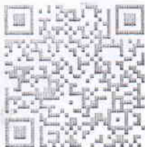
ГРАФИК ПЛАТЕЖЕЙ* к договору (контракту) от 14.07.2022 г. № 52

между Muhammadali Zokirjon Service МЧЖ и Самарканд шаҳар Халқ таълими бўлими на общую сумму 196328226,00