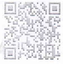
ГРАФИК ПЛАТЕЖЕЙ* к договору (контракту) от 14.07.2022 г. № 53

между WHITE WAY OF SAMARKAND и Самарканд шаҳар ХТБ марказ на общую сумму 145065451,00