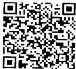
ГРАФИК ПЛАТЕЖЕЙ* к договору (контракту) от 14.07.2022 г. № 60-06/22

между ООО ABL SOFT&SS и Муйнок тумани хокимият на общую сумму 315000000,00