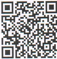
ГРАФИК ПЛАТЕЖЕЙ* к договору (контракту) от 20.07.2022 г. № 119707

между "ALMAZ KAPITAL KCLASS" MCHJ и Жанубий Мирзачул магистрал канали бошкармаси на общую сумму 141982992,00