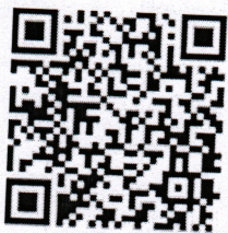
ГРАФИК ПЛАТЕЖЕЙ* к договору (контракту) от 06.07.2022 г. № 1

между "KUMUSH TEKSTIL FABRIK" и Бухоро вилоят фтизиатрия ва пульмонология маркази на общую сумму 199000000,00