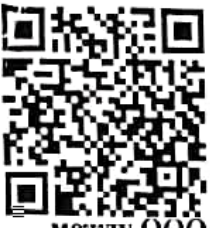
ГРАФИК ПЛАТЕЖЕЙ* к договору (контракту) от 19.07.2022 г. № 08-22

между ООО ARX MAXIMUM PROEKT и Бузатов тумани халк таълими бўлими (МБ) на общую сумму 35500000,00