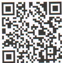
ГРАФИК ПЛАТЕЖЕЙ* к договору (контракту) от 27.07.2022 г. № 7110

между Ахмат Шер МЧЖ и Қизилтепа туман ХТБ на общую сумму 142700000,00