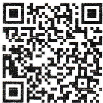
ГРАФИК ПЛАТЕЖЕЙ* к договору (контракту) от 07.07.2022 г. № 7

между "Akvamarin Grand Servis" и Бухоро шаҳар МТБ на общую сумму 250966000,00