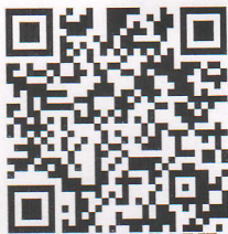
ГРАФИК ПЛАТЕЖЕЙ* к договору (контракту) от 08.08.2022 г. № 3

между JAVLONBEK MAXSUS DIZ TOZALASH MCHJ и Республика ОИТС га карши кураш маркази на общую сумму 19190960,00