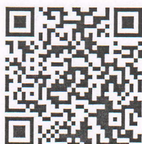
ГРАФИК ПЛАТЕЖЕЙ* к договору (контракту) от 02.08.2022 г. № 02/08-01

между "ООО PHAROS AMBITION" и Жиззах вилоят Кўзи ожизлар кутубхонаси на общую сумму 88500000,00