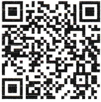
ГРАФИК ПЛАТЕЖЕЙ* к договору (контракту) от 08.08.2022 г. № 18

между "ZILOL QURILISH OMAD" МЧЖ и Бухоро шаҳар МТБ на общую сумму 255000000,00