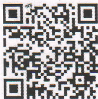
ГРАФИК ПЛАТЕЖЕЙ* к договору (контракту) от 16.08.2022 г. № 6

между "Строй мелио монтаж" МЧЖ и Янгийул шахар Ободонлаштириш бошкармаси на общую сумму 910350000,00