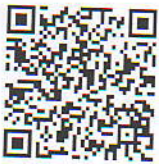
ГРАФИК ПЛАТЕЖЕЙ* к договору (контракту) от 16.08.2022 г. № 6 445-10-148-ТВ/2022

между ООО "REAL-ACTIVE-BIZNES" и Ангрен Шахар Тиббиёт Бирлашмаси на общую сумму 261275255,00