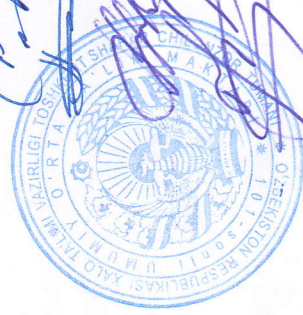
С.Нормуродов -ХТБ бош иқтисодчи котиб