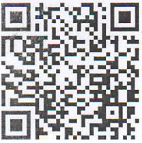
ГРАФИК ПЛАТЕЖЕЙ* к договору (контракту) от 17.08.2022 г. № 36

между "ENTERPRICE TRAVEL" МСНУ и Ховос тумани ҳокимлиги на общую сумму 28200000,00