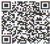
ГРАФИК ПЛАТЕЖЕЙ* к договору (контракту) от 29.08.2022 г. № 182-4-57-ОВ

между "SUPER VEGA MERKURIY" КТХСИЧК и Дехконобод туман ободонлаштириш бошкармаси на общую сумму 447695398,00