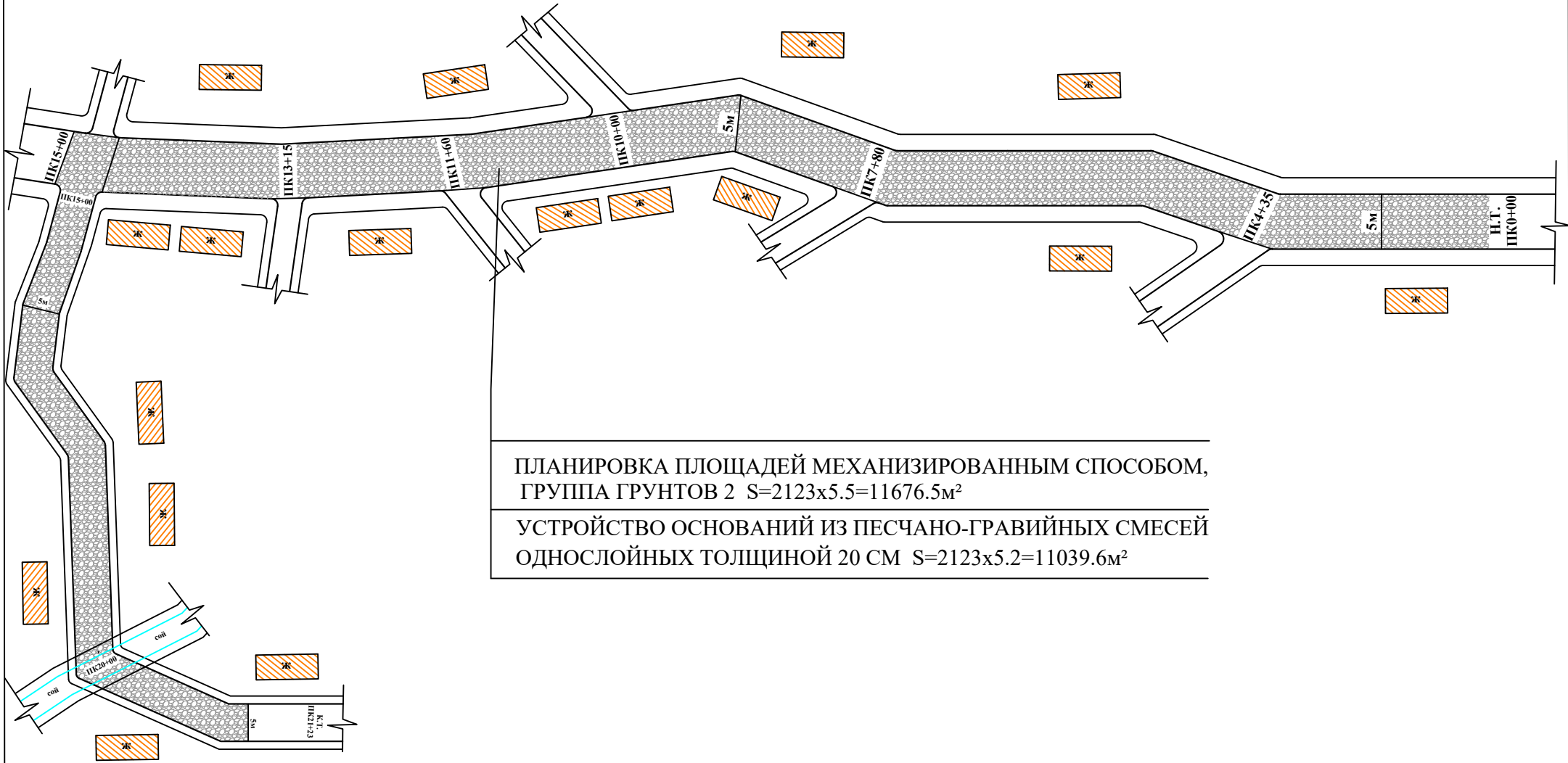
Схема Самарқанд вилояти Қушработ тумани Қавинчи МФЙ 2-кучасини жорий таъмирлаш L=2123 м.

ПЛАНИРОВКА ПЛОЩАДЕЙ МЕХАНИЗИРОВАННЫМ СПОСОБОМ, ГРУППА ГРУНТОВ 2 S=2123 \times 5.5 = 11676.5 \text{ м}^2