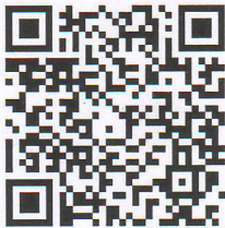
ГРАФИК ПЛАТЕЖЕЙ* к договору (контракту) от 29.08.2022 г. № 1

между МСНЖ 'WELCOME GUESTS' и Тошкент вилояти тери-таносил касалликлари дипансери на общую сумму 161708800,00